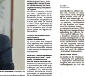
Das VRG sieht bei vielen Liegenschaftsfällen nicht, was gut und was schlecht ist.

Die vier Verordnungen zum Immobilienmarkt sind im Bundesgesetz über den Wohnungsbau (WB) enthalten. Die vier Verordnungen sind: 1. Verordnung über die Liegenschaftsvermittlung (VL), 2. Verordnung über die Liegenschaftsvermittlung (VL), 3. Verordnung über die Liegenschaftsvermittlung (VL), 4. Verordnung über die Liegenschaftsvermittlung (VL).